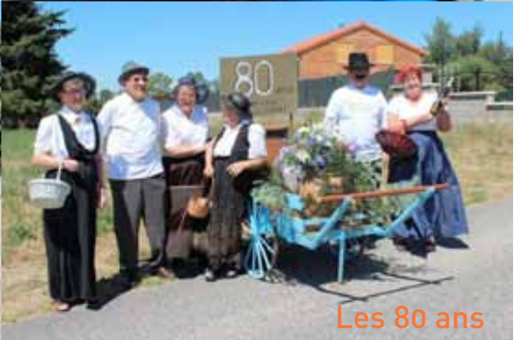
Les 80 ans