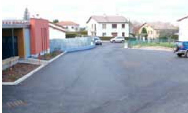
Exterieurs de la salle des fêtes

Mardi 5 janvier 2016 N'oubliez pas la collecte de sang à la salle des fêtes !