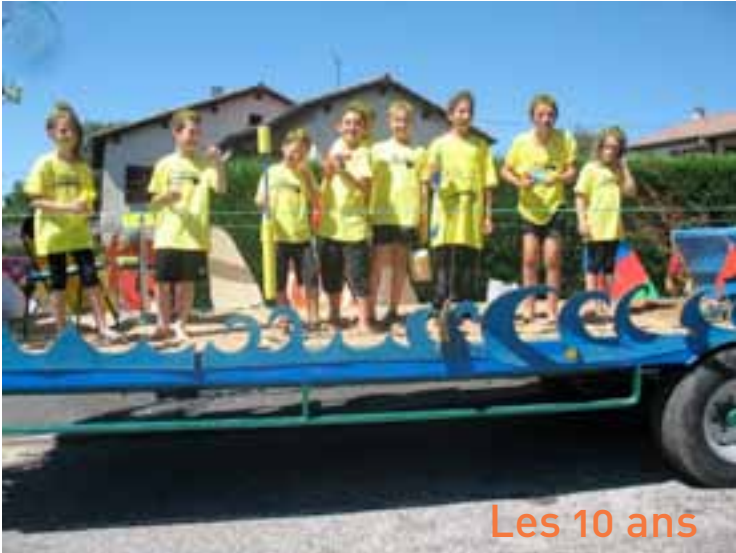
Les 10 ans