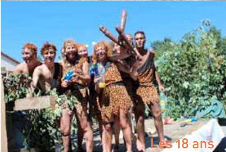
Les 18 ans