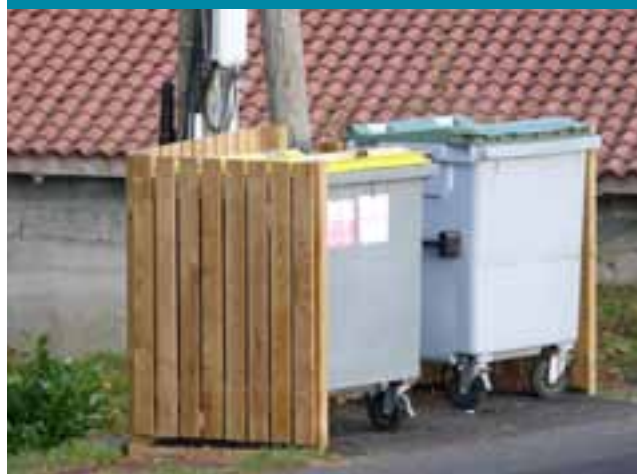
Cache conteneur réalisé par nos agents techniques