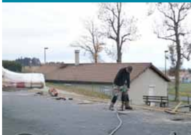
Vincent lors de la pose du terrain multisports