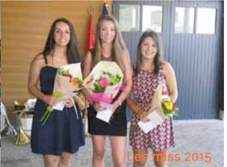
Les miss 2015