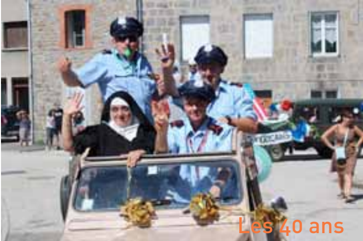
Les 40 ans