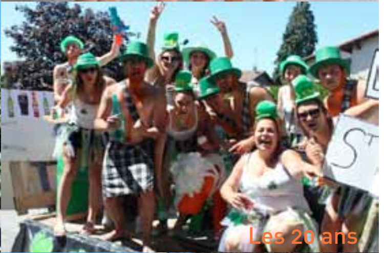
Les 20 ans