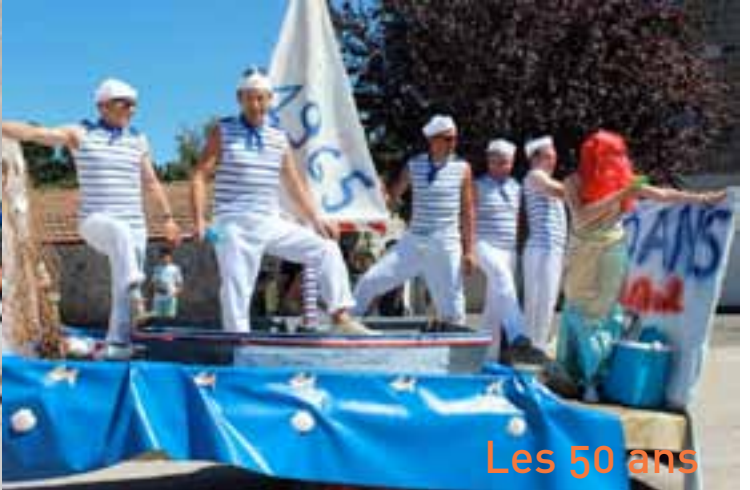
Les 50 ans