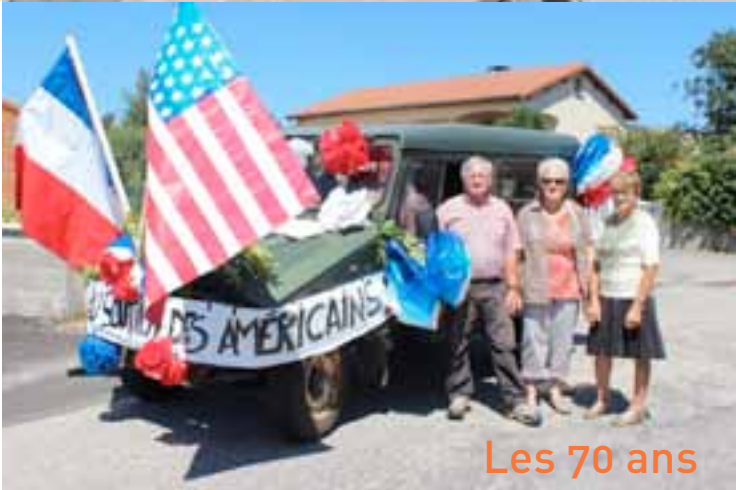
Les 70 ans